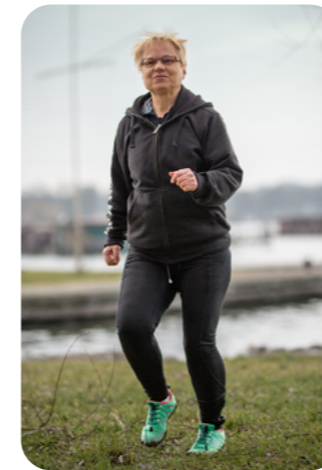
Den gesamten Körper bewegen, z. B. springen und trippeln, mindestens 5 Minuten.

Unsere Muskeln und Gelenke arbeiten reibungslos, wenn sie vorher durch Bewegung erwärmt wurden. Kommen die Teilnehmenden eines Voluntourismus-Einsatzes mit dem Fahrrad oder zu Fuß zu einem Einsatzort, dann ist ihr Körper i. d. R. ausreichend erwärmt. Ist es sehr kalt oder reisen die Teilnehmenden mit dem Auto an, dann ist eine 10minütige Aufwärmphase, die vom Betreuungspersonal des Einsatzes angeleitet wird, sinnvoll.