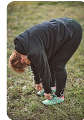
Den Rumpf nach unten und nach hinten bewegen, die Arme mitnehmen, alles mindestens 10 Mal.