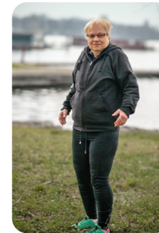
Die Schultern kreisen, mindestens 10 Mal.